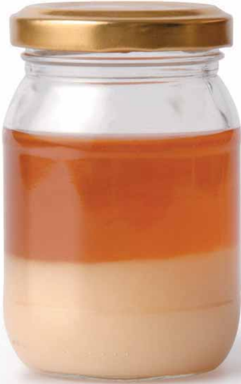
Şekil 1: Balda kristalleşme