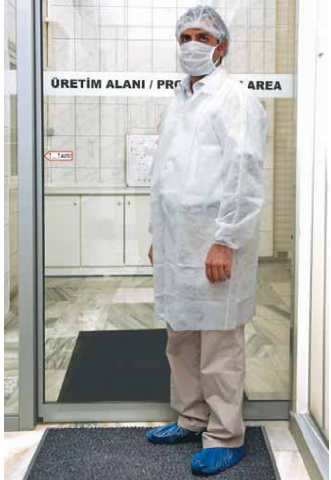
Şekil 12: Üretim alanına girmeden önce bone, galet giyilmelidir. Dış alanda giyilen kıyafet ve ayakkabılarla üretim alanına girilmemelidir.