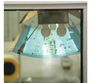
Şekil 10: Zararlılarla mücadele için tüm dışa açılır pencelerde sineklik bulunmalı ve gerekli yerlere zararlı öldürücüler asılmalıdır.