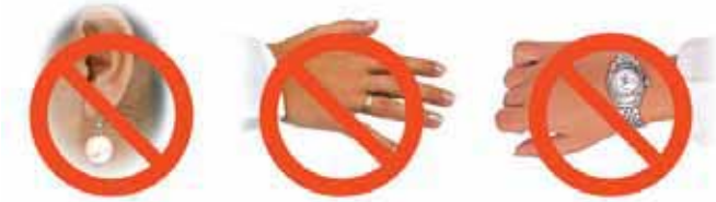
Şekil 11: Üretim alanına girmeden önce takılar çıkarılmalıdır.