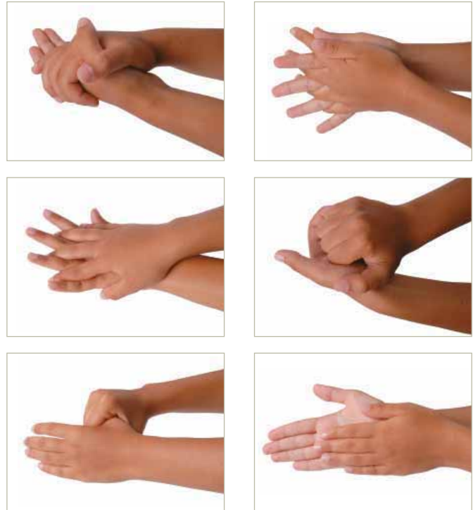
Şekil 7: Üretim alanına girmeden önce ve tuvalet sonrasında eller şekildeki gibi yıkanmalıdır.