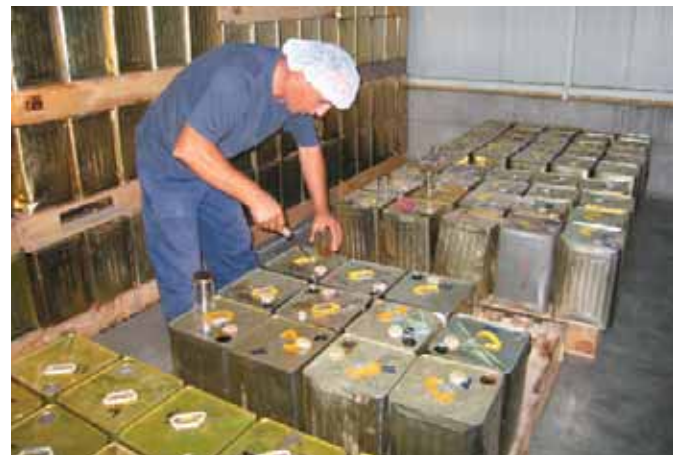
Şekil 4: Süzme balda tenekelerden numune alma işlemi