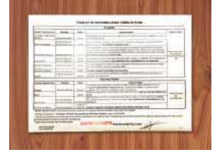
Şekil 9: Üretim alanına girişte uyarıcı yazılar asılmalıdır. Kritik noktaların temizlik planları ilgili yerde asılı olmalıdır.